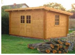
GERÄTEHAUS 4,0 x 3,0m EISBÄR