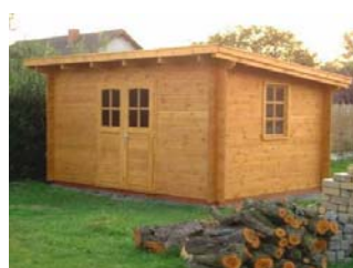
GERÄTEHAUS 4,0 x 3,0m EISBÄR

Individuelle Bepflanzung mit Biosaatgut möglich